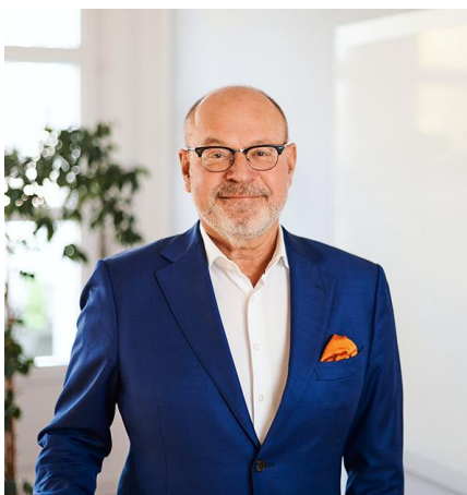
Lex Hartman / © Sunvigo GmbH